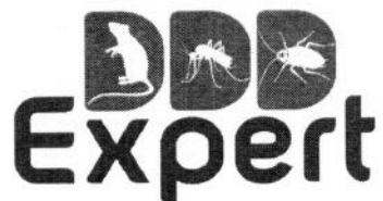
ГРАФИК ЗА ПРОВЕЖДАНЕ НА МЕРОПРИЯТИЯ ПО КОНТРОЛ НА БЪЛХИ